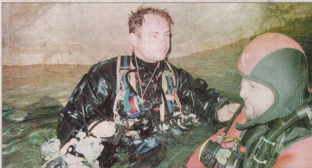
A legszebb élmény maga a merülés