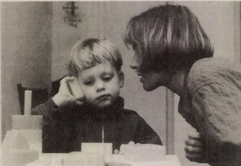
Küzdelem a hangokért

A Hallássérültek Országos Szövetségének régi terve, hogy hozzanak létre a nagyothallók és a siketek részére egy szociális otthont. Rengeteg levelet, telefont kapnak ugyanis, hogy az idős emberek képtelenek kommunikálni orvosokkal, a