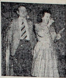
Dura Béla (Hódmezővásárhely): „A szervezetek figyeljenek a sajátban megjelenő pályázatokra, pályázzák meg a támogatást. A célfeladatokhoz ez elérhető pénzügyi forrás”