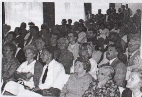
Teltház a CEU-ban

Összességében a nemzetközi napok rendezvénysorozatának fontos szakmai eseménye volt a történelmi emlékülés. Igazolta ezt a CEU dísztermének telt háza, melyben a beállított pót-széksorok ellenére sem maradt hely