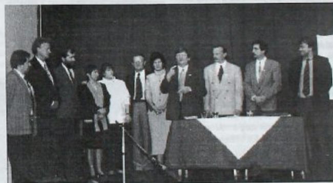
A SIKETEK ÉS NAGYOTHALLÓK ORSZÁGOS SZÖVETSÉGÉNEK ÚJ ELNÖKSÉGE