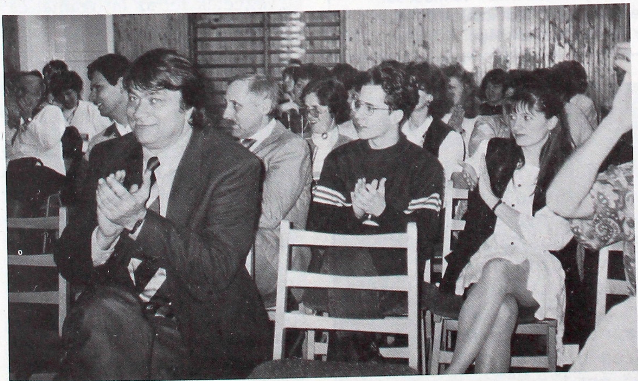
Eredményhirdetés – fotónkon is jól látható, hogy mindenki elégedett volt