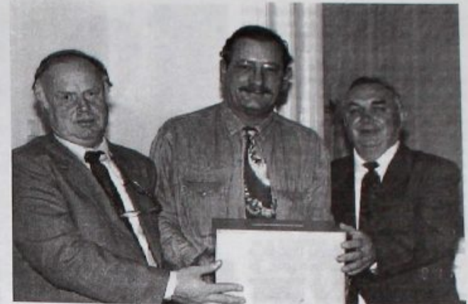
Munkára készen – a szavazatszámoló bizottság

Lapzárta: a megjelenést megelőző hónap 20-ig!