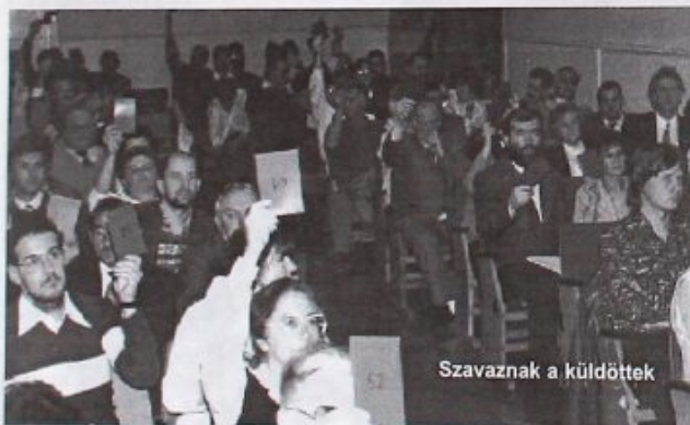
Szavaznak a küldöttek