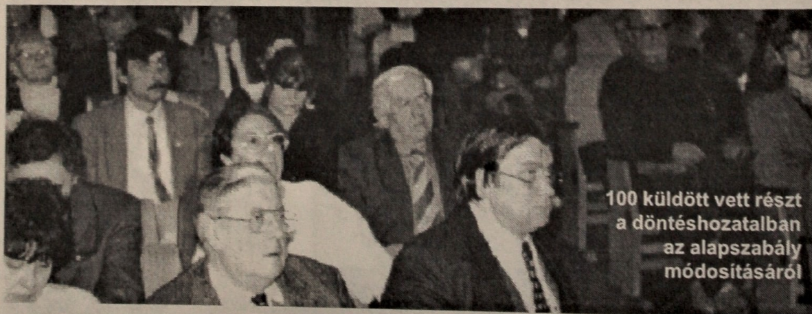
100 küldött vett részt a döntéshozatalban az alapszabály módosításáról